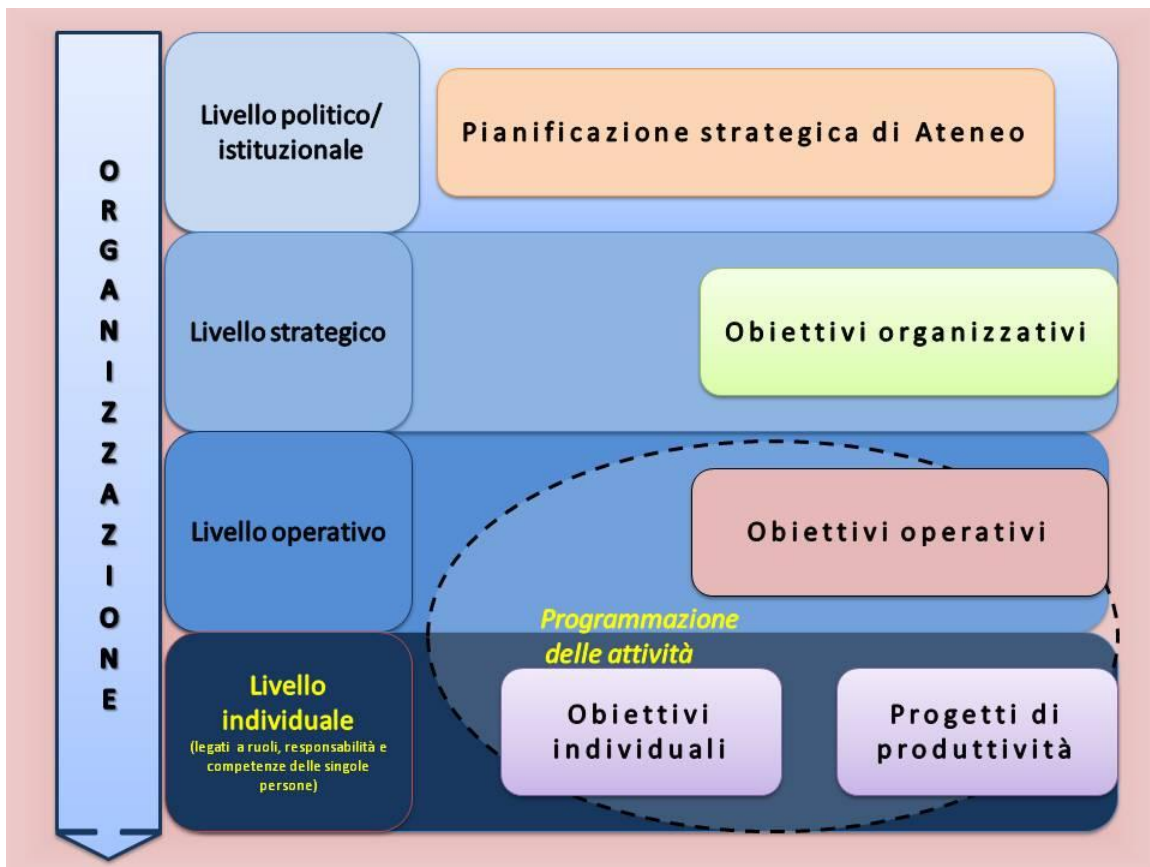
Figura - Processo a cascata di declinazione degli obiettivi